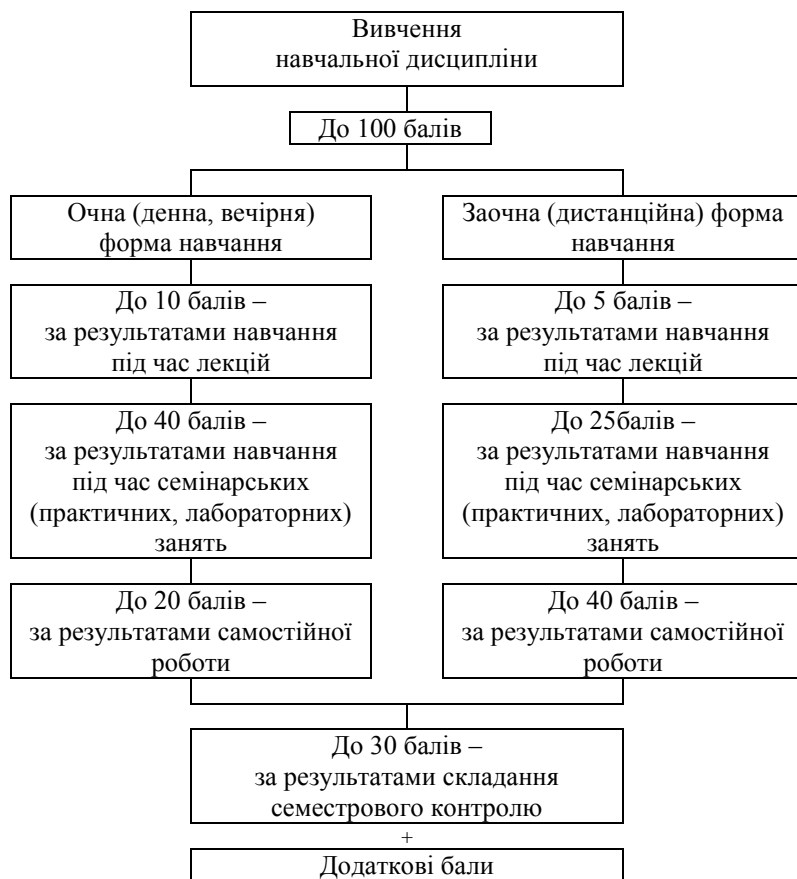
Рис. 2.1. Схема нарахування балів студентам за результатами навчання

2.1. Нарахування балів студентам з навчальної дисципліни здійснюється відповідно до такої схеми: